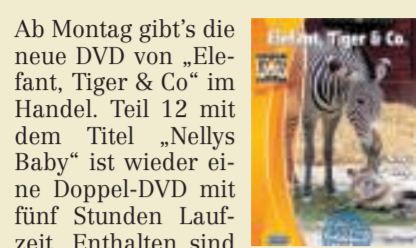
Neuer Teil 12

Ab Montag gibt's die neue DVD von „Elefant, Tiger & Co.“ im Handel. Teil 12 mit dem Titel „Nellys Baby“ ist wieder eine Doppel-DVD mit fünf Stunden Laufzeit. Enthalten sind zwölf Folgen der gleichnamigen MDR-Serie mit Geschichten von tapferen Bären, wilden Pferden und Tieren mit scharfen Krallen. Darunter die Geschichte von Zebradame Nelly und ihrem Baby, die beide bei einem Ausflug auf der Afrika-Savanne in den Wassergraben stürzten. Eine dramatische Situation: Nur mit Hilfe einer beherzten Zoobesucherin, die dem Jungtier den Kopf über Wasser hielt, wurde Nellys Baby gerettet.